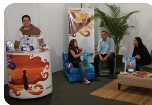
Stand montado na Fashion Business