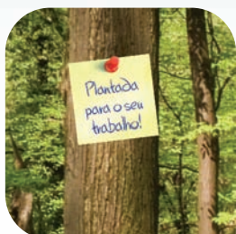
Conquista do Certificado FSC. Pag. 4