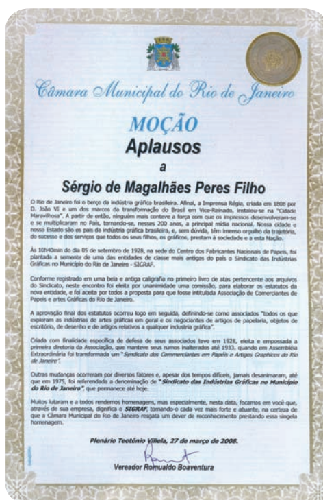
Moção da Câmara Municipal.