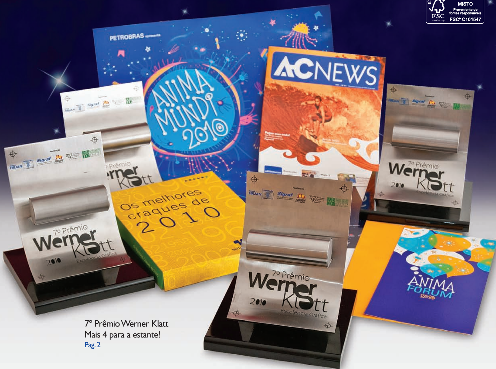
7º Prêmio Werner Klatt Mais 4 para a estante! Pag. 2