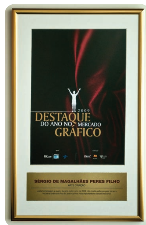
Prêmio concedido pelo mercado gráfico.