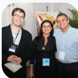
Presença em eventos Pag. 5 e 6